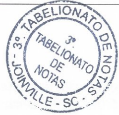
Isabelle Liesly Ziehe Escrevente Notarial