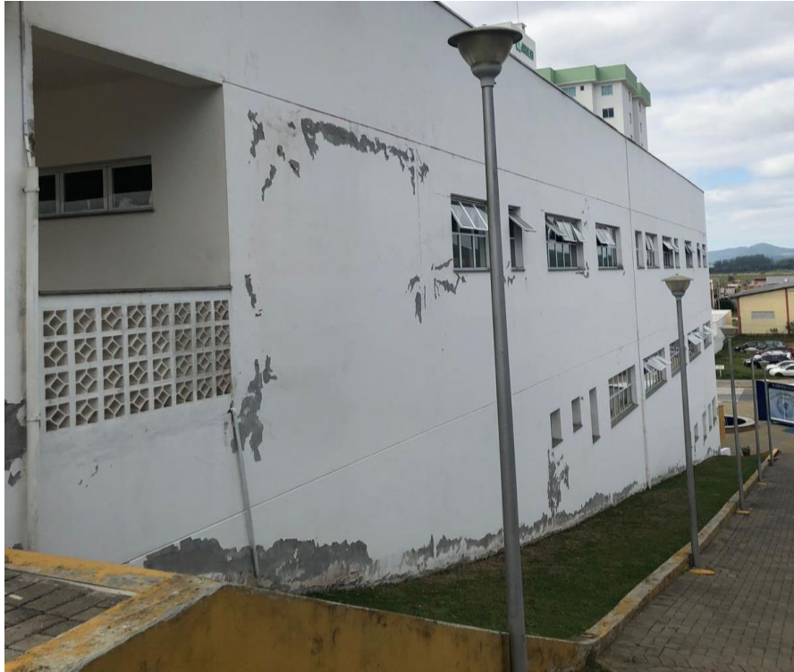
Foto 01: Vista lateral esquerda, localizada na Rua Jakceia Andrade.