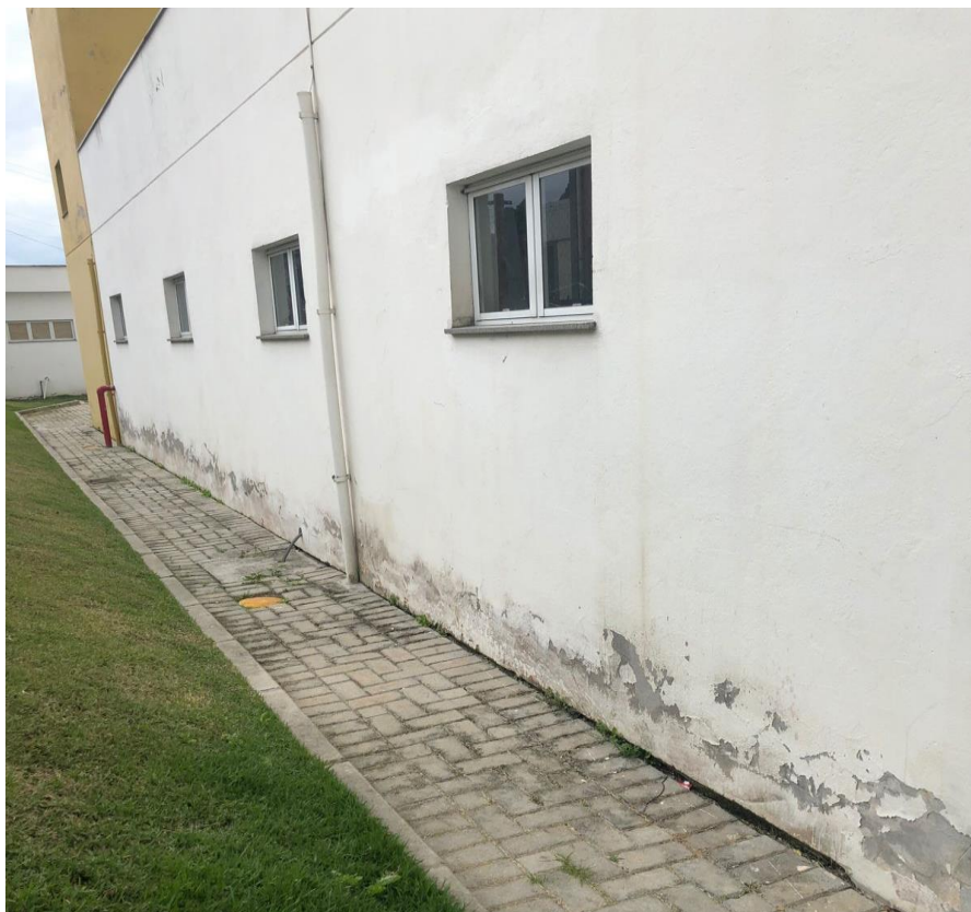
Foto 04: Parede externa ao lado direito do início do guarda-corpo.