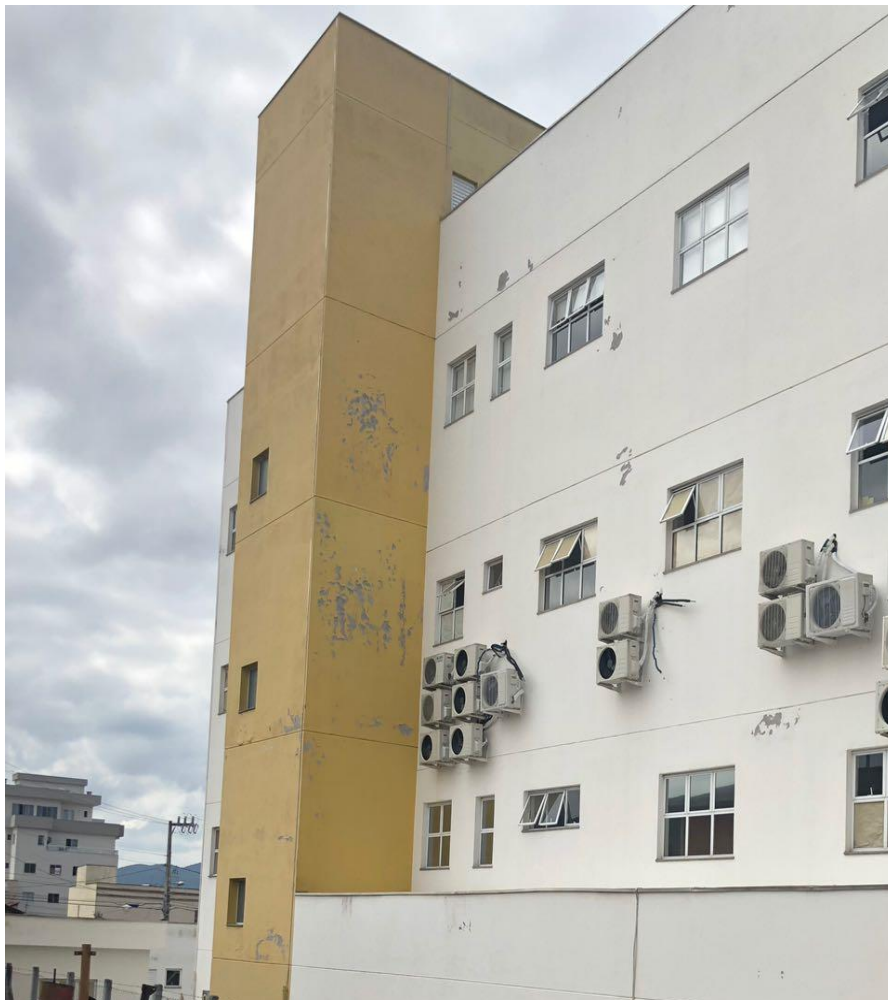
Foto 05: Parede externas amarela ao lado direito do início do guarda-corpo, continuação da parede da foto anterior e também na parede em que se encontra instalados os ar-condicionados.