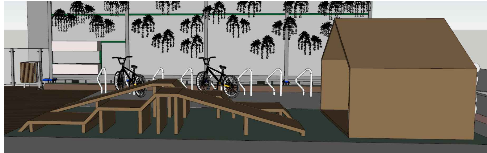
2 PERSPECTIVA LATERAL S/ ESCALA