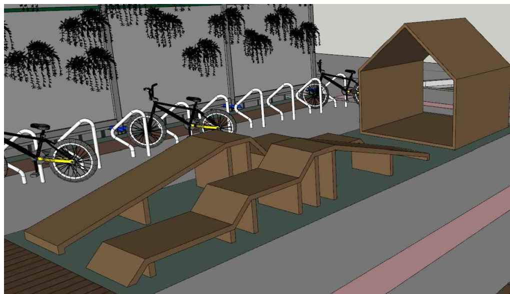
4 PERSPECTIVA LATERAL S/ ESCALA