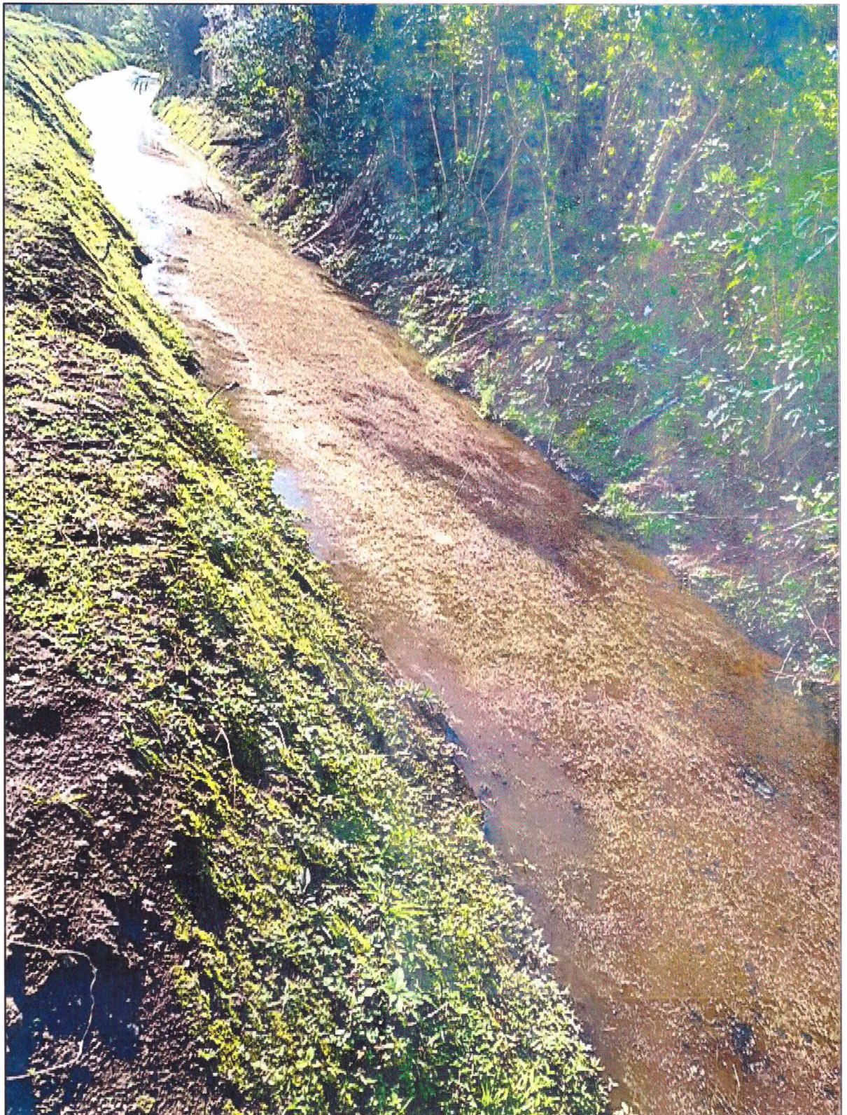
Figura 3 - Percurso da água servida expondo não só a largura do trecho de escoamento, mas também o prolongamento das camadas graxosas ao longo de todo o trecho investigado.