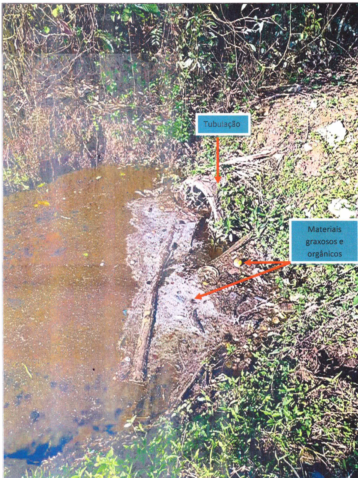
Figura 2 - Tubulação em Concreto que direciona águas servidas e de forte odor aos fundos da área do requerente. É possível notar a presença de materiais graxos, oleosos bem como matéria orgânica.