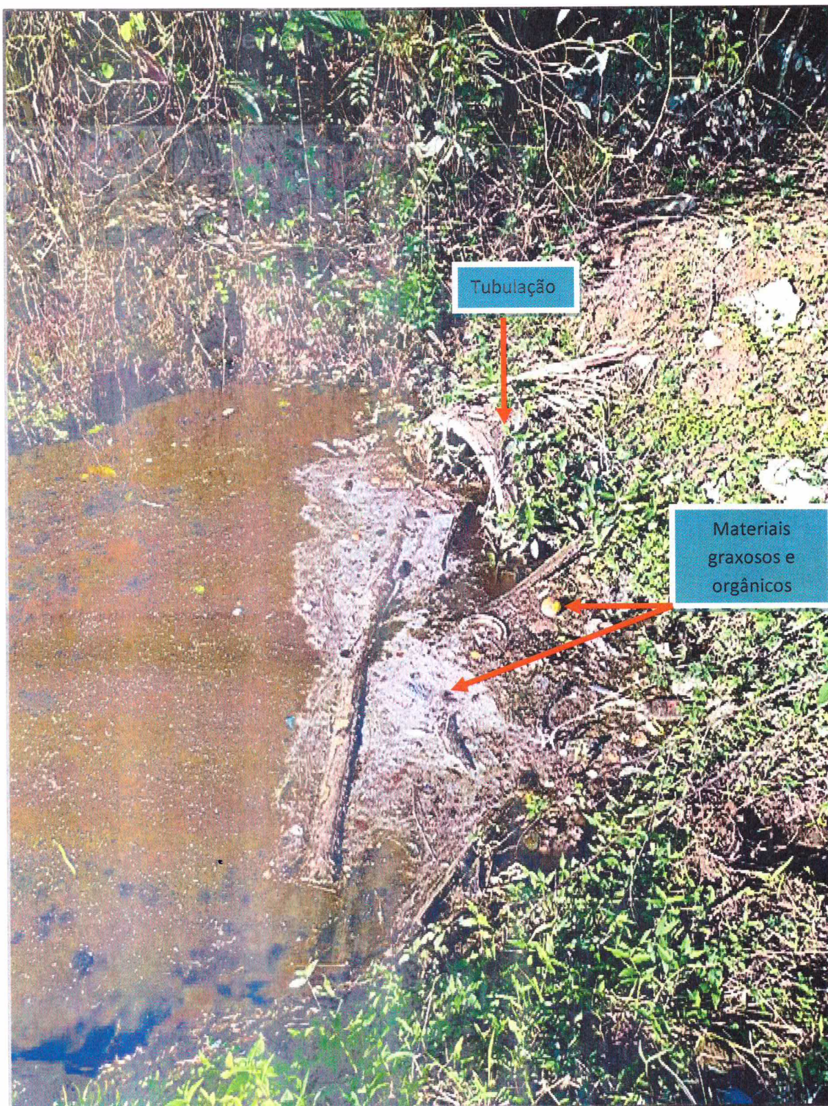
Figura 2 - Tubulação em Concreto que direciona águas servidas e de forte odor aos fundos da área do requerente. É possível notar a presença de materiais graxos, oleosos bem como matéria orgânica.