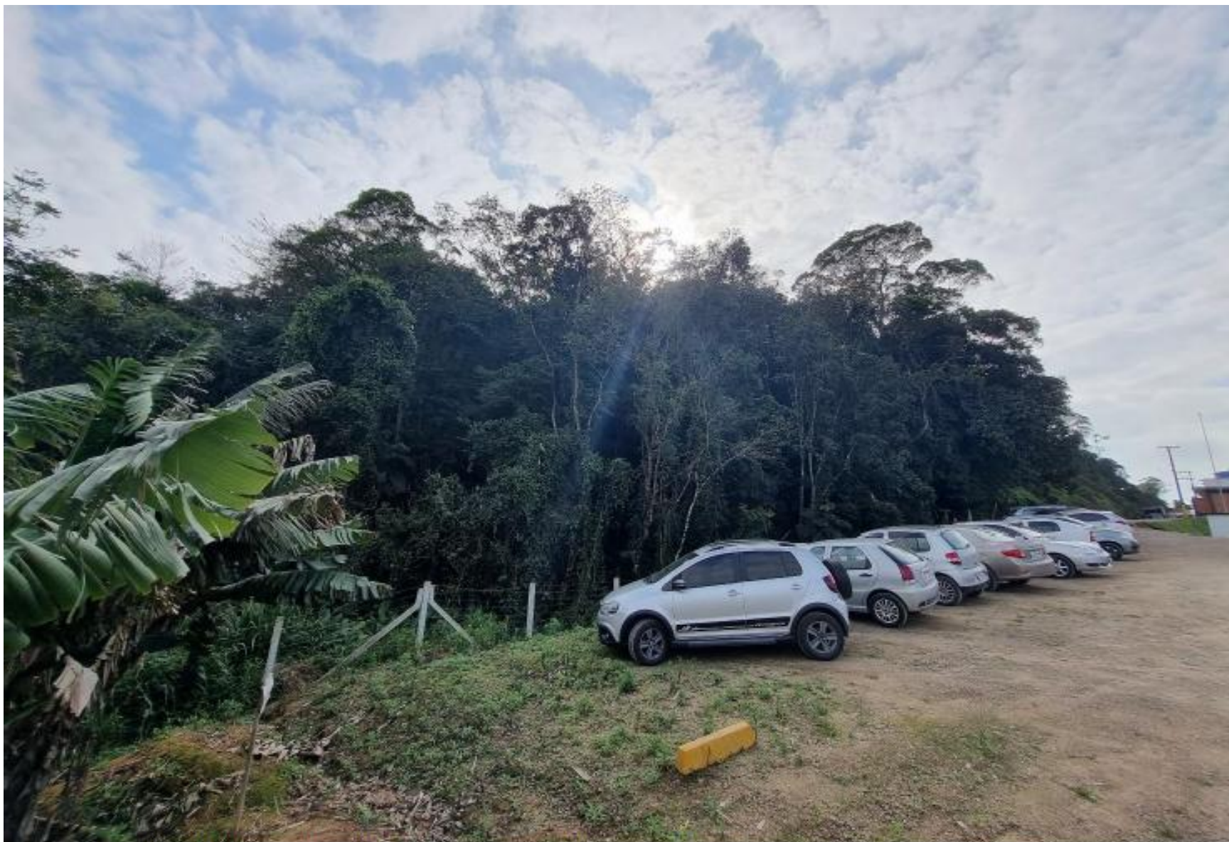
Imagem: Foto batida do imóvel avaliando frente com rua Francisco Merlo, no sentido para o início da rua.