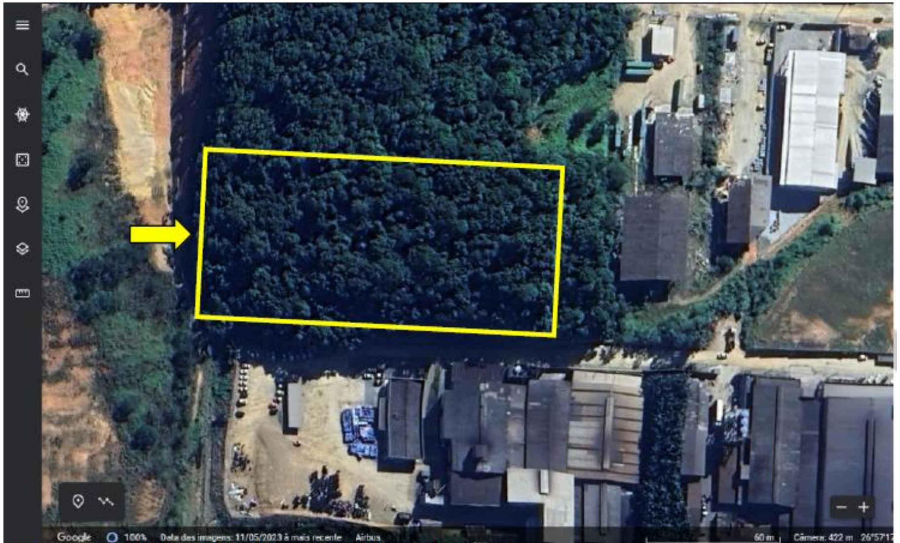
Imagem fornecida pelo Google Earth – Vista aérea do imóvel avaliando.